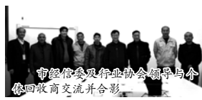
市经信委及行业协会领导与个回收商交流并合影